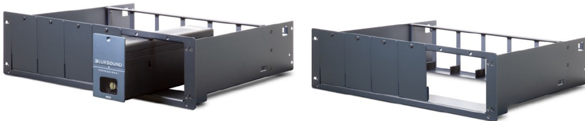
RM160 Rack Mount Accessory, with 1 x B160S loaded (L) and without (R)

Für maximale Vielseitigkeit und Platzeffizienz in einem 19"-Systemträger ermöglicht es der RM160 bis zu sechs B160S-Geräte in einen 3HE-Rackeinschub zu montieren inkl. Kabelmanagement und Leerblenden für eine saubere und erweiterbare Installation.