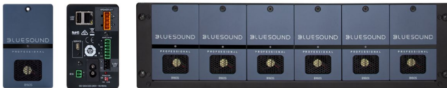
B160S BluOS Streaming Stereo Amplifier, front and rear view, and 6 units in RM 160 rack accessory

Der B160S hingegen ist ein sehr kompakter 2-Kanal-Verstärker mit integriertem BluOS-Player, der das gestreamte Audio in einer Stereo-Zone abspielen kann. Bis zu sechs B160S mit jeweils 3HE passen nebeneinander in ein 19"-Rack