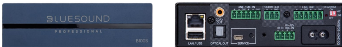
B100S BluOS Network Streaming Player, front and rear view

Der B100S ist ein 19" fähiger, 1-Zonen Streamer, der entweder mit einem Verteilverstärker mit passiven Lautsprechern oder direkt mit Aktivlautsprechern verbunden werden kann. Mit dem optionalen RM100- können bis zu drei B100S-Einheiten in einer Höheneinheit im Rack installiert werden.