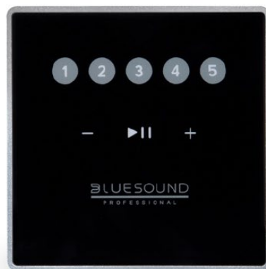
CP 100 Wall Mount Controller, with basic playback controls and preset buttons

Für diejenigen, die es vorziehen mit Hardware-Steuerungen zu arbeiten, ist die CP100 ein flaches, beleuchtetes, berührungsempfindliches Wandsteuergerät. Passend auch für deutsche Installationsbuchsen. Ausgestattet mit PoE, ist es einfach zu installieren und mit dem Netzwerk zu verbinden. Die Steuerung kann zum Schutz vor unbeabsichtigter oder unbefugter Benutzung gesperrt werden.