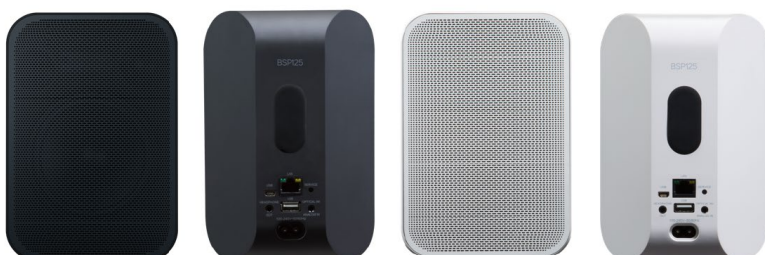
BSP125 BluOS Streaming Speaker, front and rear view, black and white finishes

Ausgestattet mit einem kräftigen 3,5" (89 mm) Langhub-Tieftöner und einer 1" (25,4 mm) Hochtonkalotte, ist der preisgekrönte BSP125 mit 25W ein effizienter, aktiver Lautsprecher mit eingebauter DSP für EQ und andere Audiofunktionen. Er ist BluOS-fähig und kann sich mit netzwerkfähigen Musikquellen verbinden und mit anderen BluOS-Geräten im selben Netzwerk kommunizieren. Mit einem für seine Größe überraschend voluminösen Klangbild über den gesamten Frequenzbereich (45Hz bis 20kHz) sowie einer THD+N von nur 0,003% bei voller Leistung, ist der BSP125 ein vielseitig einsetzbarer Premium-Lautsprecher für jede kommerzielle Installation. Der BSP125 kann auf einem Regal installiert oder mit einer optionalen Halterung an Decke oder Wand montiert werden. Erhältlich in schwarz oder weiß.